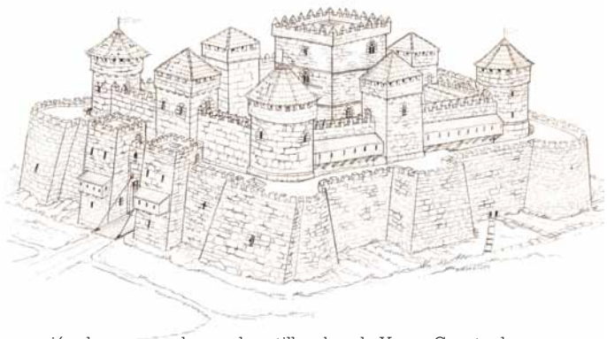
Recreación de como pudo ser el castillo, obra de Xurxo Constenla.

Los objetos recogidos en el castillo muestran la doble función militar y social de la fortaleza. Se conservan docenas de grandes piedras esféricas, llamadas bolaños, que fueron lanzadas contra el castillo, pero también trozos de cerámicas de lujo y de otros materiales que hablan del elevado nivel socio-económico de los residentes de Rocha Forte.